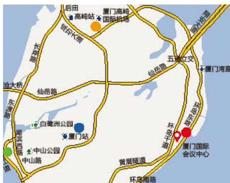
● 厦门国际会议展览中心（厦门市思明区会展路198号） ● 厦门高崎国际机场 ● 厦门火车站 ● 厦门轮渡码头